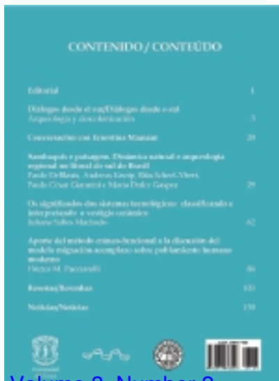
Volume 3, Number 2