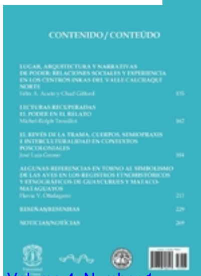
Volume 4, Number 1